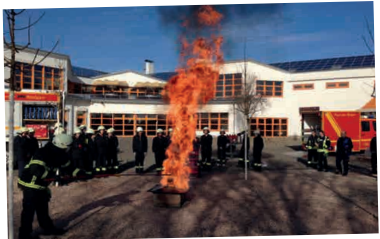
IM EINSATZ IN DER SCHULE: FREIWILLIGE FEUERWEHR RODGAU

Das mehrstufige Ausbildungsprogramm verzahnt unter einem ganzheitlichen Ansatz bisher für sich stehende kultusministerielle Sozialprogramme (Brandschutzerziehung, Schulsanitätsdienst, Bewegte Schule, Berufs- und Studienförderung, Amokprävention) im Zeichen der Förderung zivilbürgerlichen Engagements mit einer zentralen Aufgabe des Staates: dem Bevölkerungsschutz und der Katastrophenhilfe.